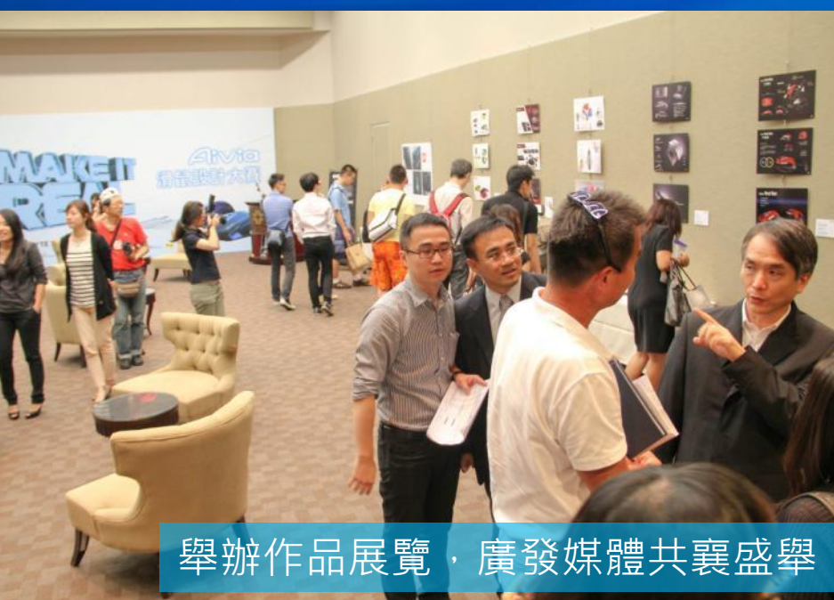
舉辦作品展覽，廣發媒體共襄盛舉