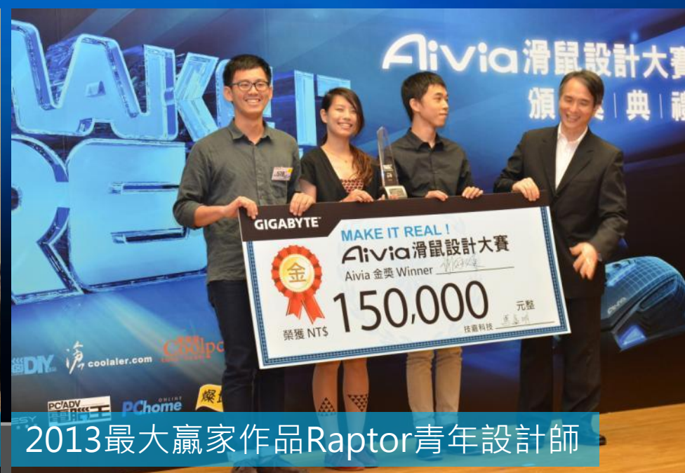
2013最大贏家作品Raptor青年設計師