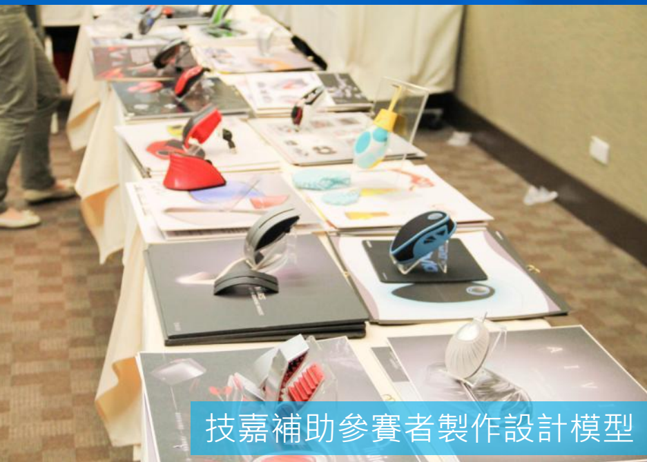
技嘉補助參賽者製作設計模型