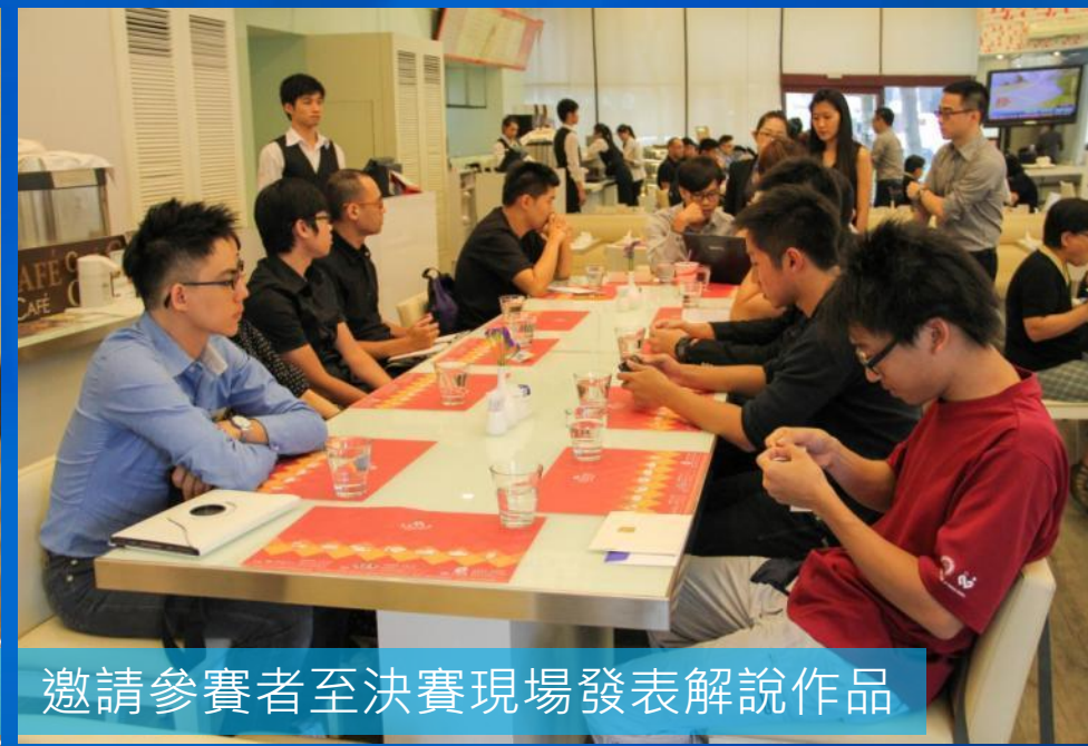
邀請參賽者至決賽現場發表解說作品